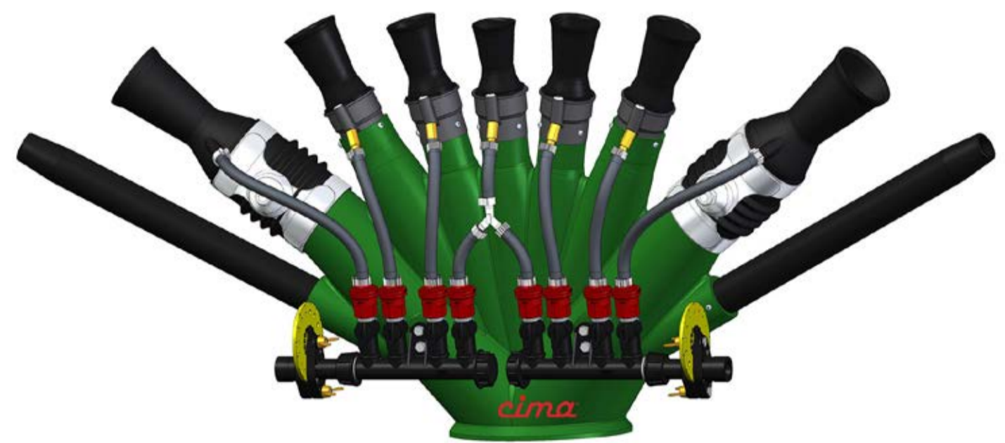
TENDONE - Testata