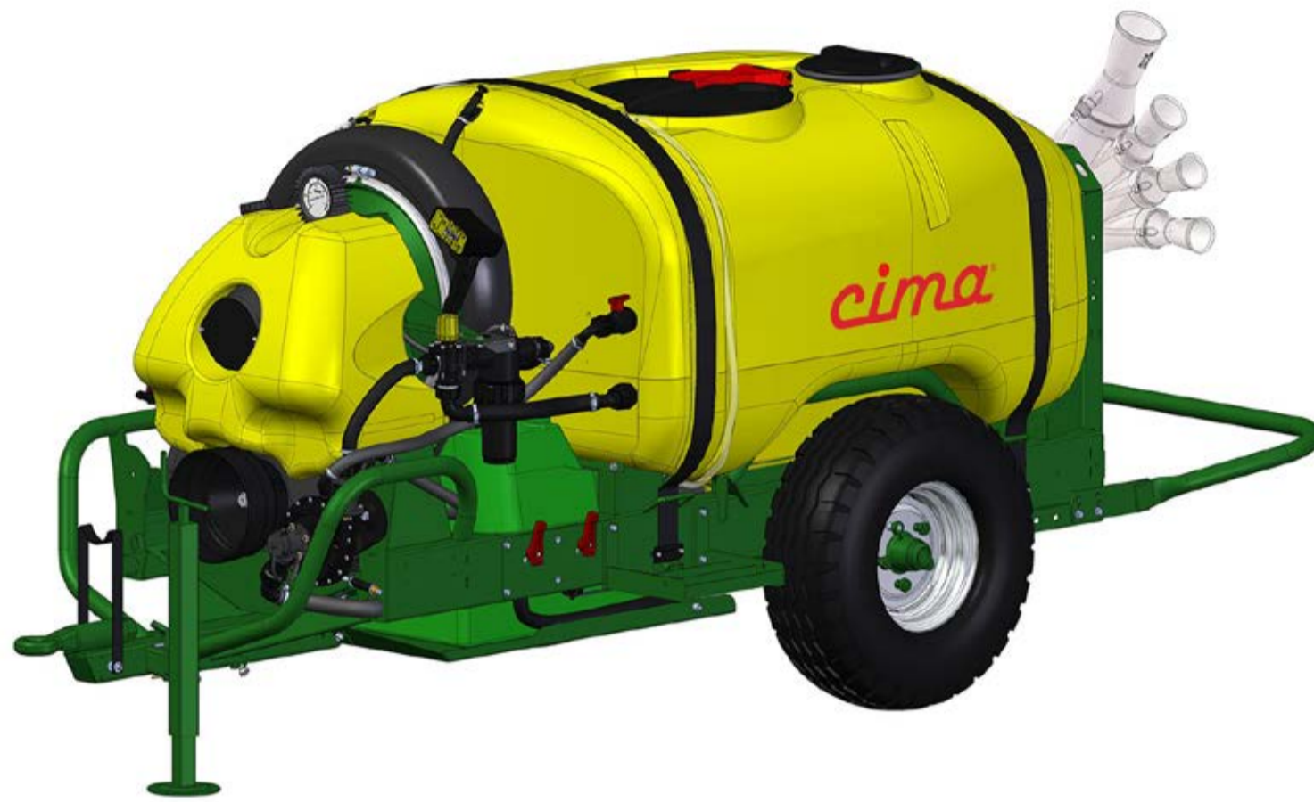
BLITZ 50 - Atomizzatore trainato

ATOMIZZATORE TRAINATO PNEUMATICO A BASSO VOLUME BLITZ 50 CON TESTATA TENDONE