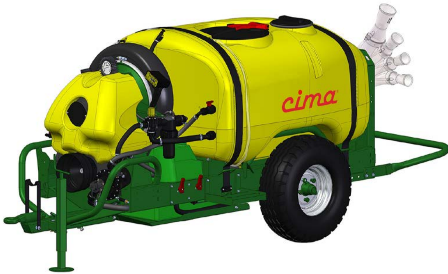
BLITZ 50 - Trailed sprayer